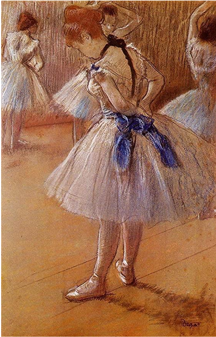
E.Degas baletdejtājas . Pastels